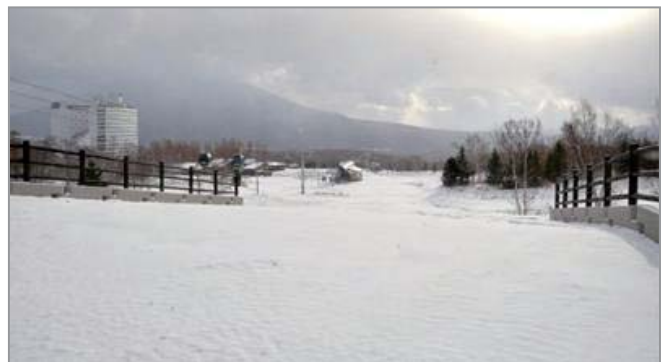
新コース「あげいも」距離:1,200m