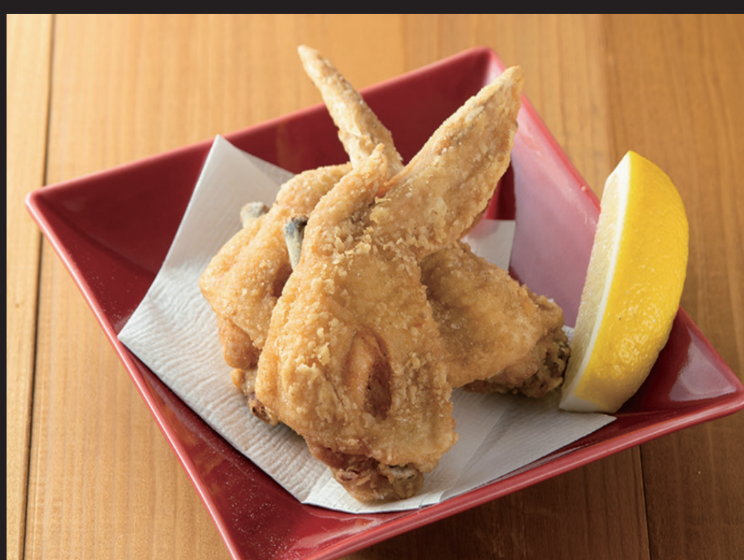
手羽の唐揚げ ¥1,380 Karaage (Chicken wings) Fried chicken wings.