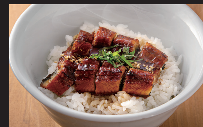
うなぎごはん ¥1,680 Eel Rice