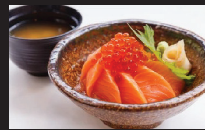
サーモン親子丼 ¥4,850 Salmon Oyako-don