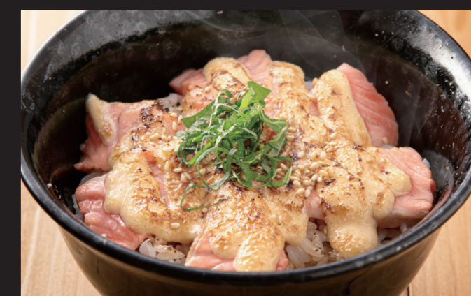
炙りサーモンごはん ¥1,680 Aburi Salmon Rice