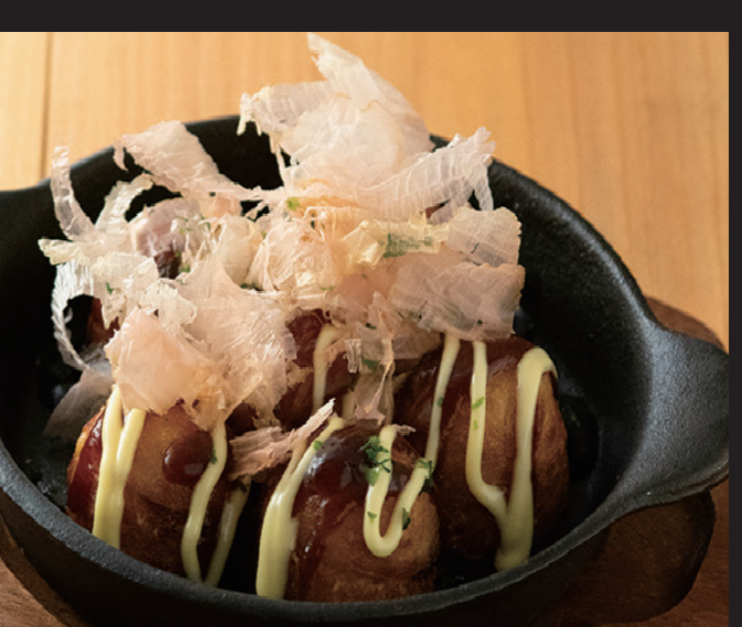
揚げたこ焼き ¥1,380 Fried Takoyaki Fried takoyaki, Bonito flakes, green seaweed and mayonnaise, takoyaki sauce.