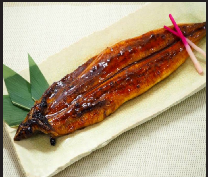
うなぎ蒲焼一本焼 ¥5,500 Glaze-grilled Eel

*Please ask the staff as it changes depending on the stock.