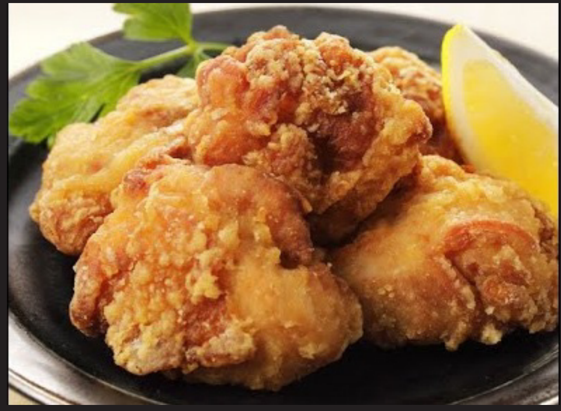
もも肉の唐揚げ ¥1,680 Chicken Thigh Karaage