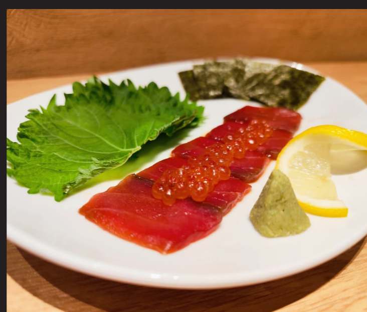
特製まぐろ漬け ¥1,680 Gogyo Marinated Tuna