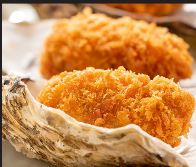
北海道産カキフライ ¥1,500 Hokkaido Fried Oyster