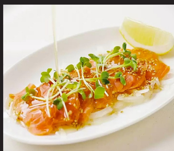
本日のカルパッチョ ¥3,880 Today's Fish Carpaccio