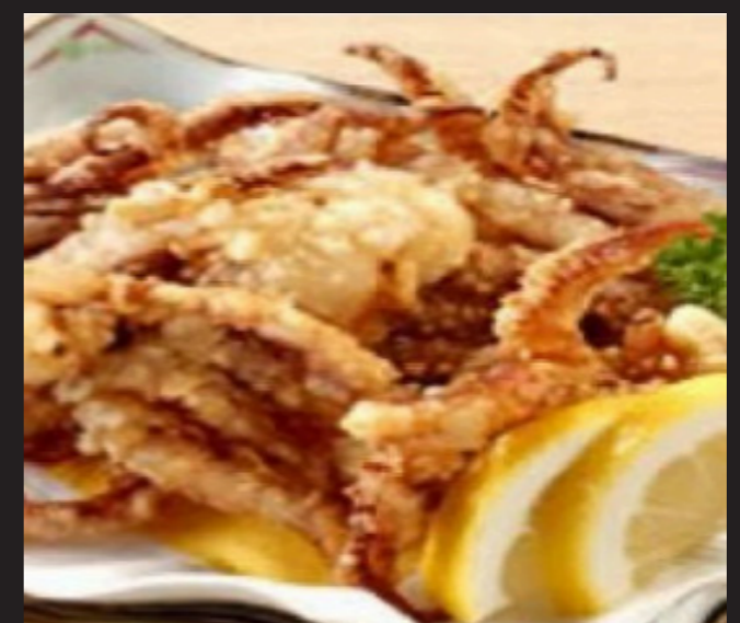
イカゲソ唐揚げ ¥1,680 Squid Karaage