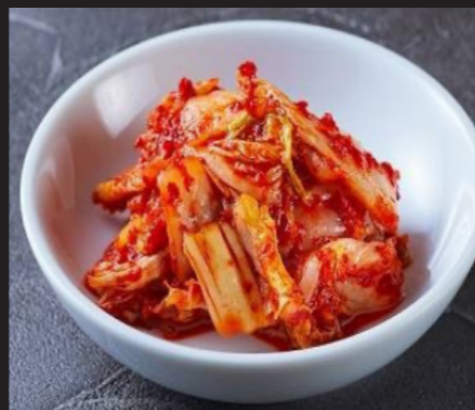
キムチ ¥490 Kimchi