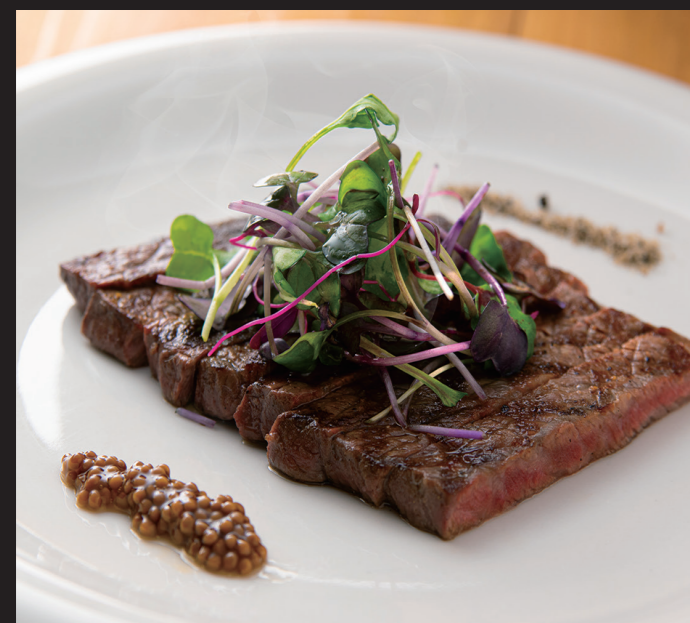
和牛ステーキ ¥9,980 Wagyu Steak