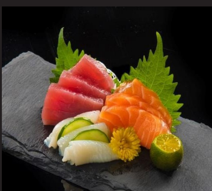
本日の刺身 ¥3,600 Today's Sashimi