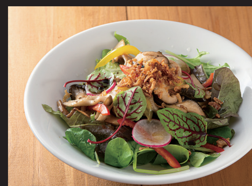
キノコサラダ ¥1,680 Mushroom Salad Sautéed 5 types of mushroom salad.