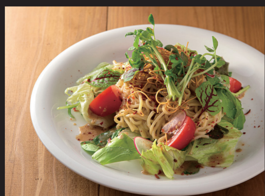
キノコサラダ ¥1,680 Hokkaido Ramen Salad Mixed vegetable, noodles, sesame dressing.