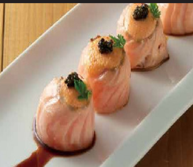
サーモンロール ¥1,980 Salmon Roll