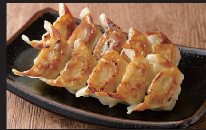
餃子 ¥990 Gyoza