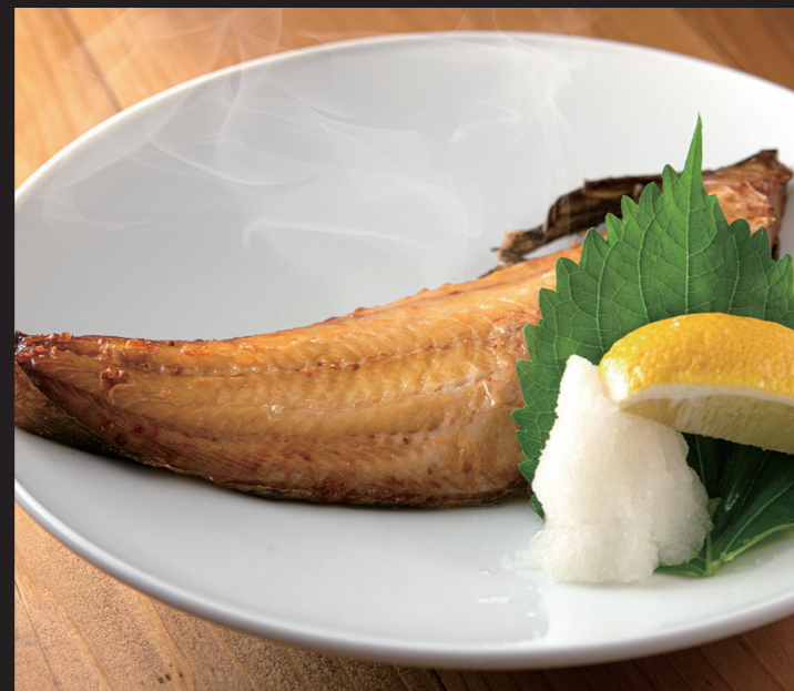
本日の焼き魚 ¥4,880 Today's grilled fish

*Please ask the staff as it changes depending on the stock.