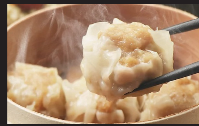
五行豚シューマイ ¥1,550 Gogyo Pork Shumai