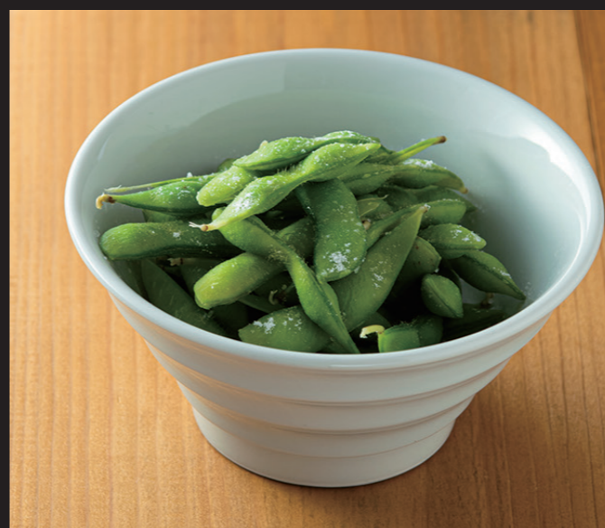
枝豆 ¥500 Edamame Boiled edamame