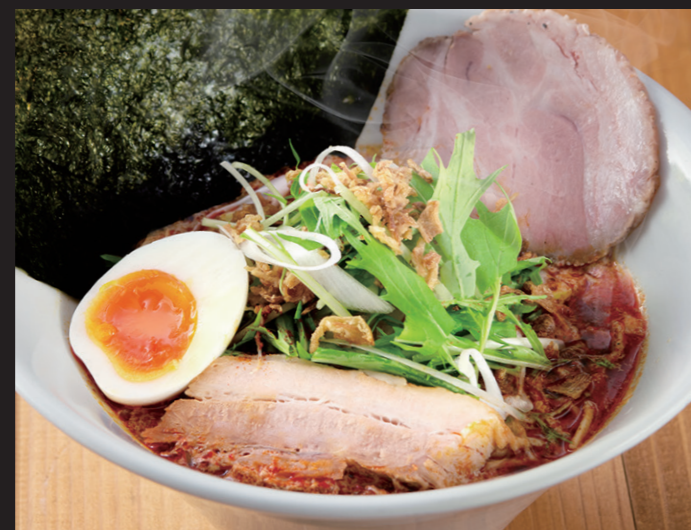
スパイシーラーメン ¥2,200

Tonkotsu Ramen Silky pork broth, half umami egg, kikurage mushroom, spring onions, pork belly chashu and pork loin chashu.