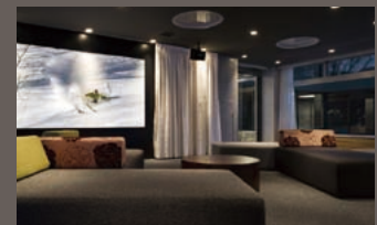
ベースキャンプ BASE CAMP