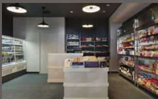
売店「桜」 SHOP SAKURA

Featuring unrivalled views the Green Leaf's 46 sqm suites include a modern living room, two flat panel televisions, a leather armchair, audio systems, a kitchenette, and powder room.